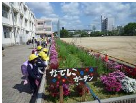
草津小学校の自慢 40mのなでしこガーデン